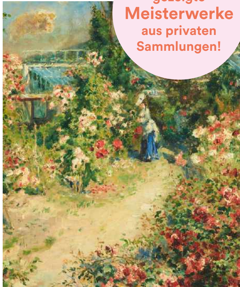
PIERRE-AUGUSTE RENOIR, Das Gewächshaus (La Serre | The Greenhouse), um 1876, Leihgabe aus Privatbesitz, Foto: © Staatsgalerie Stuttgart

Noch nie gezeigte Meisterwerke aus privaten Sammlungen!