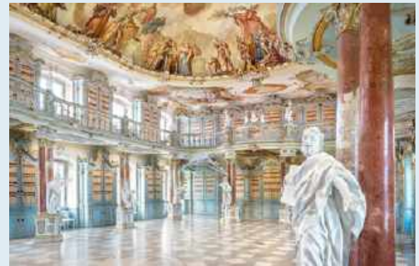
Bibliothek, Kloster Schussenried, © Staatliche Schlösser und Gärten Baden-Württemberg, Foto: Günther Bayerl

Anmeldung und weitere Informationen unter: freunde-der-staatsgalerie.de